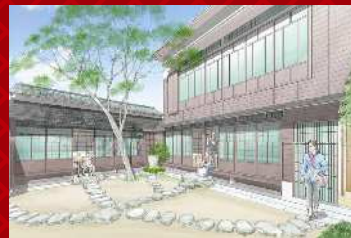
(仮称)芥川龍之介記念館 完成予想図

2026年度、東京都北区は田端の旧居跡地に(仮称)芥川龍之介記念館を開館する予定です。書斎の再現や庭、建物にも意匠を凝らし、当時を「体感(feel)」できる施設を目指しています。現在、開館に向け寄附の受付をしています。ご支援の程よろしくお願いたします。