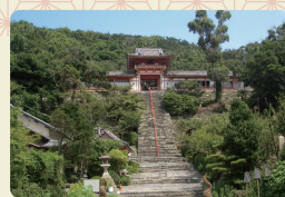
和歌浦天満宮(わかうらてまんぐう) 和歌浦湾を見守る学問の神様を祀る