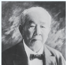
【渋沢栄一】 「近代日本人の肖像」(国立国会図書館)を加工して作成

渋沢栄一(1840~1931)と陸奥宗光の付き合いは、明治初年に遡る。明治3年(1870)に和歌山藩の用務で訪欧した陸奥はその帰途、アメリカで伊藤博文らと合流し、そこから渋沢とも交流が生じた。伊藤は陸奥と旧知の間柄で、渋沢が関係する用務でアメリカを訪れていた。