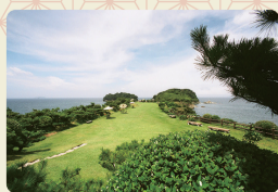
番所庭園(ぼんどこていえん) 異国船の見張り番所跡