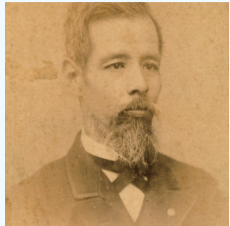
【陸奥宗光】

紀州藩士であり国学者でもある伊達宗広の六子として生まれた陸奥宗光(1844~1897)。幼少期を和歌山城下(和歌山市)で過ごしたが、父・宗広が藩内の抗争に敗れ失脚、脱藩した後、尊王攘夷運動に参加した。その後勝海舟の海軍塾に入塾。慶応3年(1867)には坂本龍馬の海援隊に入るなど、さまざまな人物との交流を深めていった。明治維新後、紀州藩十四代藩主徳川茂承(もちつぐ)に信頼され、津田出(つだいずる)と共に藩政改革に邁進した。国政に進出し農商務大臣を務めた後、第2次伊藤博文内閣で外務大臣となり、江戸時代に結ばれた不平等条約、領事裁判権の撤廃や日清戦争の講和条約(下関条約)を結ぶなどの偉業を達成した。