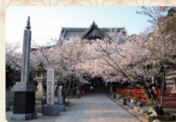
紀三井寺(きみいでら) 歴代藩主が祈願に参拝