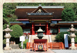
紀州東照宮(きしゅうとうしょうぐう) 関西の日光とも呼ばれている