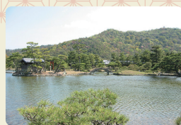
養翠園(ようすいえん) 池泉回遊式の大名庭園