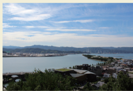
玉津島神社裏 奥供(てんぐ)山からの景色