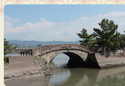
不老橋(ふるうばし) 藩主のおり道に架けられた石橋