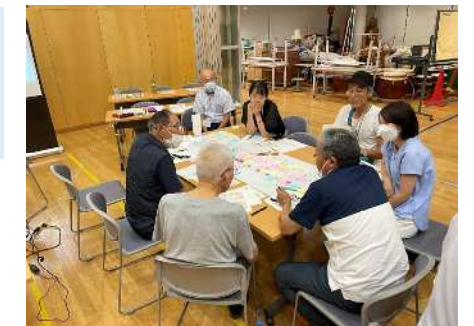
1班の話し合いの状況