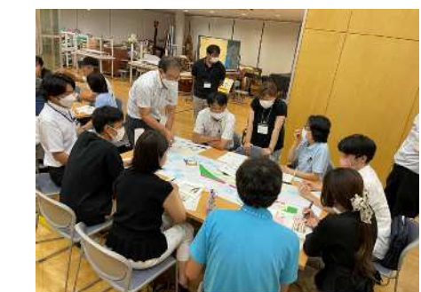
2班の話し合いの状況