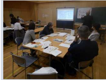
1班の話し合いの状況

第2回は、10月17日に開催し、第1回ワークショップでご提案いただいた様々なアイデアを盛り込んで、遊歩道の整備案を考えました。