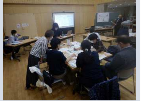
2班の話し合いの状況