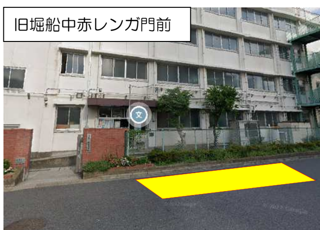
旧堀船中赤レンガ門前

【問合せ先】 北区教育振興部学校改築施設管理課 堀船中学校改築担当 電話 03 (3908) 9277 FAX 03 (3910) 6885