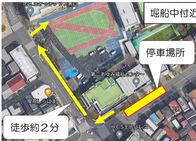
堀船中付近の停車場所