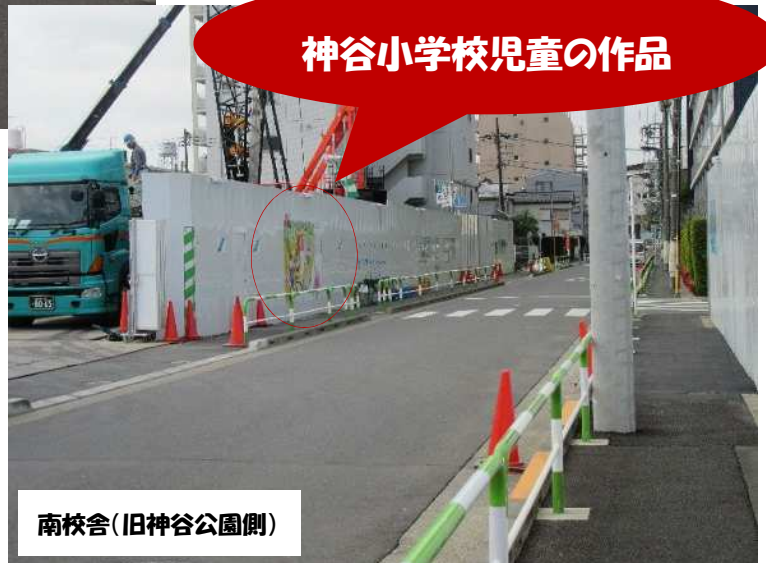
南校舎(旧神谷公園側)

神谷小学校は6年生共同制作の絵、 稲田小学校は5年生の版画の作品、神 谷中学校は全校生徒のコメントを掲示 しています！！