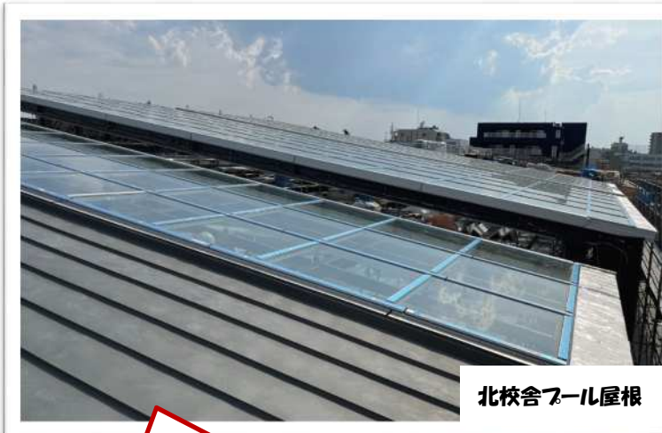
北校舎プール屋根

開閉式の屋根があるプールは 夏季に1年生から9年生までが 余裕をもって活動できます。