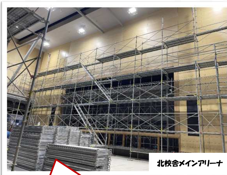
北校舎メインアリーナ

開閉式の屋根があるプールは 夏季に1年生から9年生までが 余裕をもって活動できます。