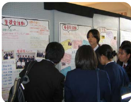
豊島中学校文化祭に来ていた豊島北中学校の生徒の皆さん