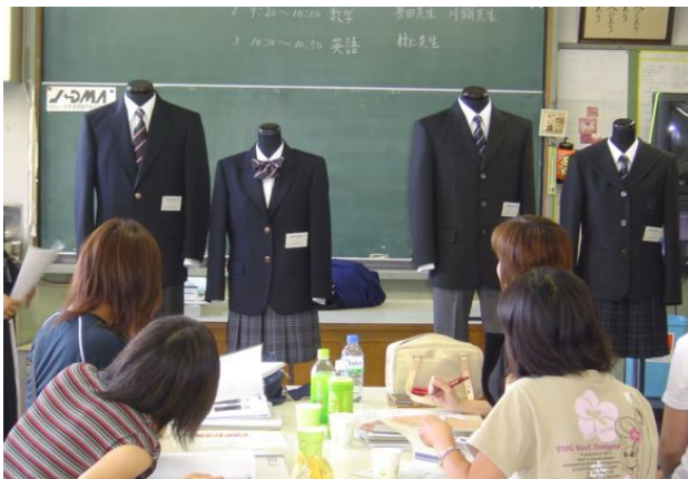
第3回標準服等検討部会でのプレゼンテーションの様子