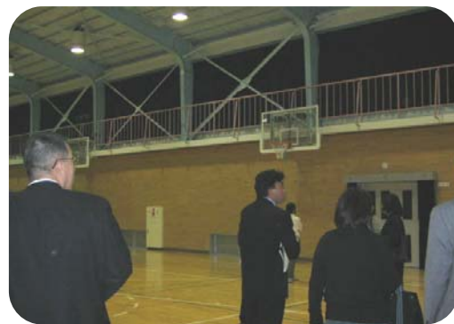
体育館を確認しています

生徒の皆さんが通う道を実際に歩いて危険な箇所がないかどうか確認することも含め、登下校時の安全確保について検討することになりました。