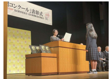
比べて読もう新聞コンクール表彰式