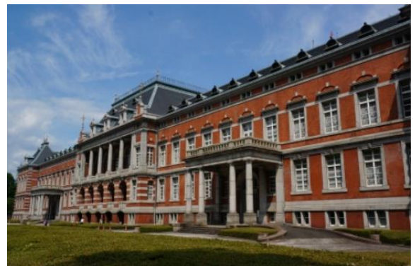
法務省旧本館（赤れんが棟）