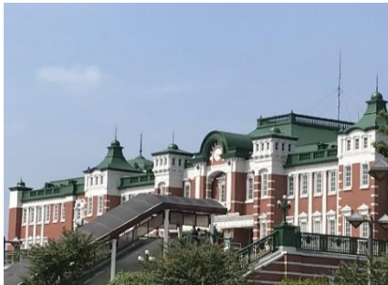
J R 深谷駅