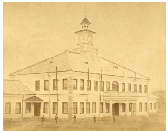
東京大学医学部全景