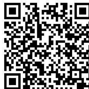
堀船中ホームページ QRコード

卒業生より、手作りの花台を卒業記念品としていただきました。きれいなお花を飾って、大切に使用させていただきます。ありがとうございます。