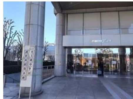
上演中の撮影は禁止のため、会場入口の写真です。

3連休の最終日、大田区民プラザ大ホールを会場に「第75回東京都中学校連合演劇発表会」が開催されました。この発表会には、明桜中演劇部が11月の区連合学芸会で最優秀賞を獲得し、北区の代表として出場しました。年末からこの日までの計4日間、東京都内中学校の各地区から選出された計20校がこのホールで演劇を披露しました。本校からは「となりのエーミール」の演目でした。文化祭や区学芸発表会後に、さらに磨きをかけ大舞台での発表でした。選出された学校の一つとして、異なる地でもとても緊張する中でしたが、それぞれが堂々と発表し、終了後には大きな拍手をいただきました。3年生にとっては、演劇部としての集大成の舞台でしたがやり切った表情でした。遠くの会場でしたが、多くの保護者の皆様にもお越しいただきました。誠にありがとうございます。1, 2年生は、これまでの先輩の姿やがんばりを受け継ぎ、新生明桜中演劇部を築き上げていってくださいね。