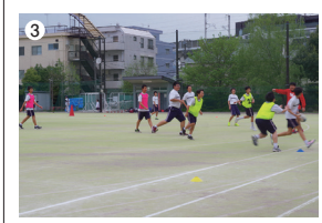
①バスケットボール部 ②剣道部 ③ラグビー部