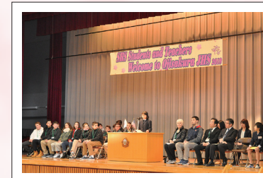
▲セブンヒルズスクール交流会

土曜授業⑩ 校外授業(2年) セブンヒルズスクール交流会 高校入試(私立・都立) 学校保健委員会 定期考査Ⅳ