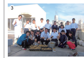
①華道部 ②演劇部 ③園芸・ボランティア部