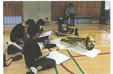
【6年生】音楽室の楽器