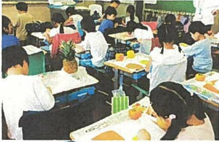
【1年生】野菜やくだもの

子どもたちの創作・表現活動を向上させる取り組みとして各学年がテーマに沿って思い思いに個性豊かに描きました。