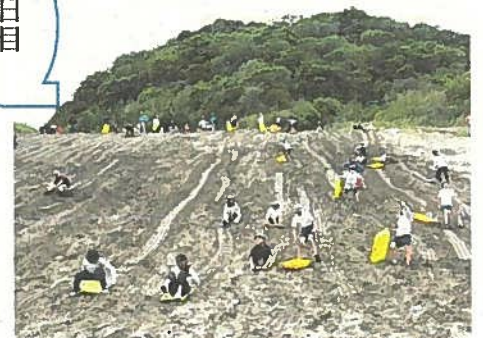
砂山でそりすべり