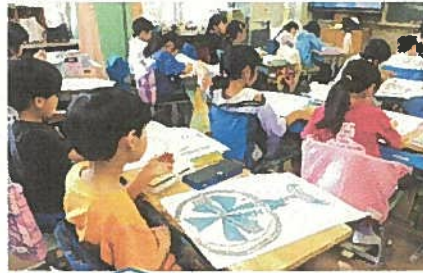
【2年生】一輪車、鍵盤ハーモニカ