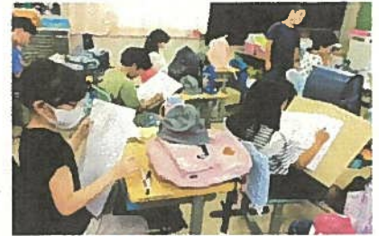
【3年生】校帽とランドセル