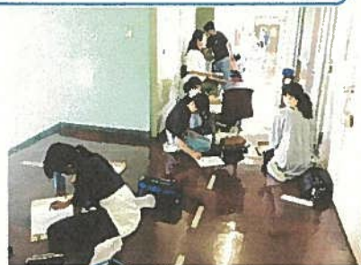
【5年生】校舎内の風景