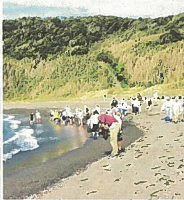
大房岬で磯の生き物を観察