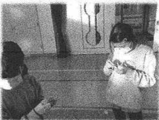
ベーゴマにチャレンジ