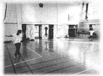
バドミントンデー