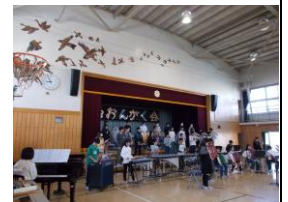
※音楽会の練習風景(6年生)