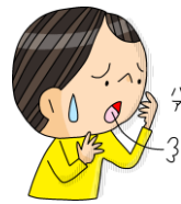
なや 悩みことや相談がある