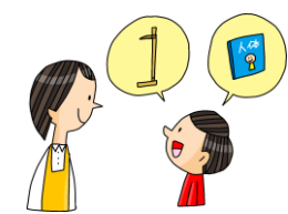
ほけんしつ もの 保健室のものを 使いたい 時(身長計や本など)は、 先生に聞きましょう。