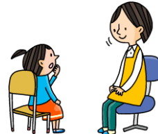
けがをした理由や体の 具合を、養護の先生に 伝えましょう。