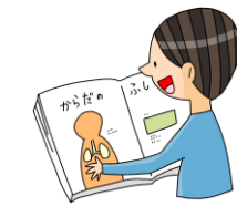
からだ 体のことについて知りたい