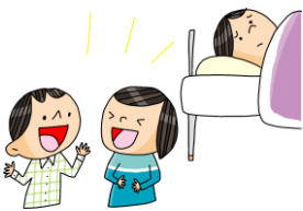
やす ひと 休んでいる人がいる時は 静かにしましょう。