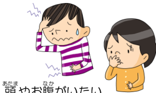
あたまやなか 頭やお腹がいたい、 気分が悪い