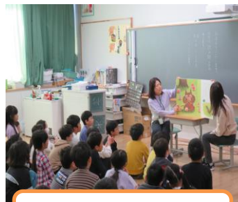
教員による読み聞かせ