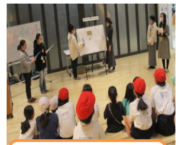
さくらんぼの会による読み聞かせ