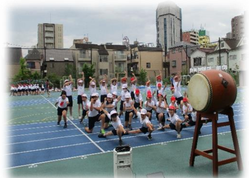
「王ーソーラン超」練習風景 5/27