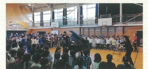
地域の方々に感謝を伝える ウインターコンサート