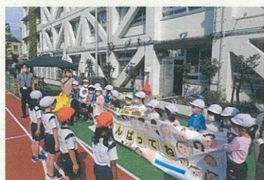
じゅうじょうなかはら 幼稚園との交流