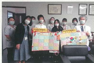
地域の方へ応援プロジェクト