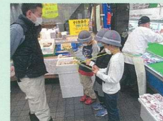
十条大好きプロジェクト