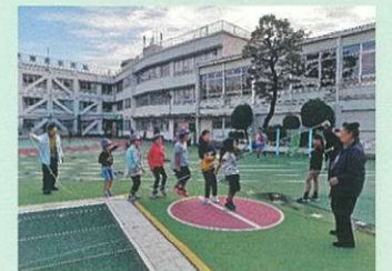
地域の方による早朝遊び