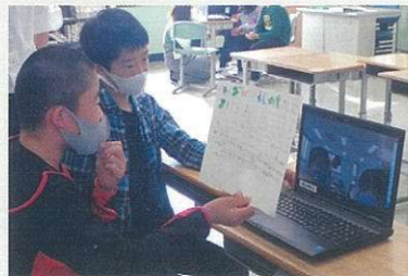
南房総市立富山学園 富山小学校との交流

十条富士見中学校 じゅうじょうなかはら幼稚園 王子第二小学校 王子第三小学校 荒川小学校 十条台小学校