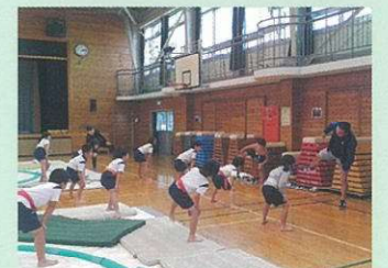
放課後における相撲の活動

文部科学省国立教育政策研究所実践研究協力校 東京都授業改善推進拠点校 北区教育委員会研究協力校