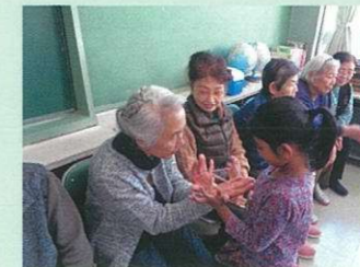
高齢者の方との昔遊び