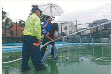
地域と連携したキャリア教育