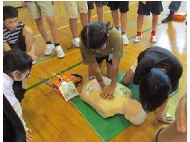
○総合防災訓練～心肺蘇生体験～