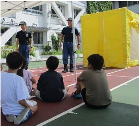
○総合防災訓練～煙体験～