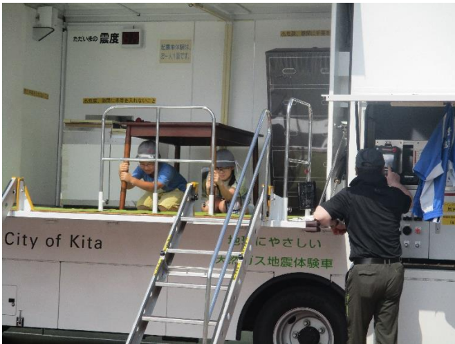
○総合防災訓練～起震車体験～