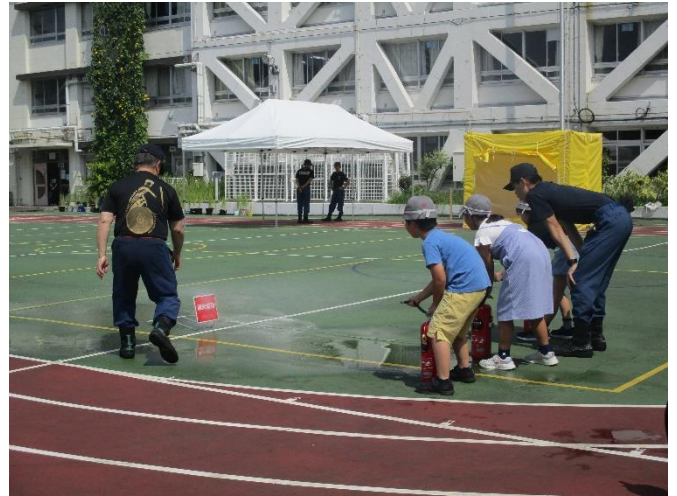
○総合防災訓練～消火器訓練～