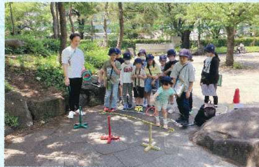
ポイントラリー大会