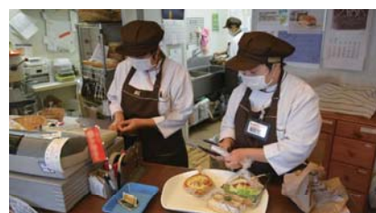
就労継続支援A型事業所(ブレッド&バター)内での作業風景

答 優先対応すべき学校の一つであるが、規模については、適正配置計画との整合性を図ると共に、児童数の推移等を慎重に見極める。