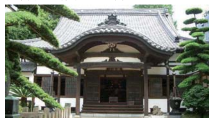
太田道灌ゆかりの静勝寺

答 都営住宅への若年層の入居促進を図るため、平成30年1月以降、毎月、若年夫婦・子育て世帯向けに募集すると聞いている。