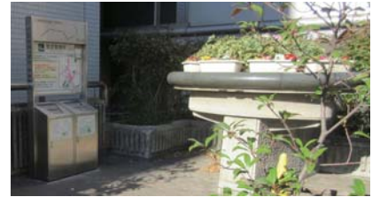
北とぴあ脇の指定喫煙所