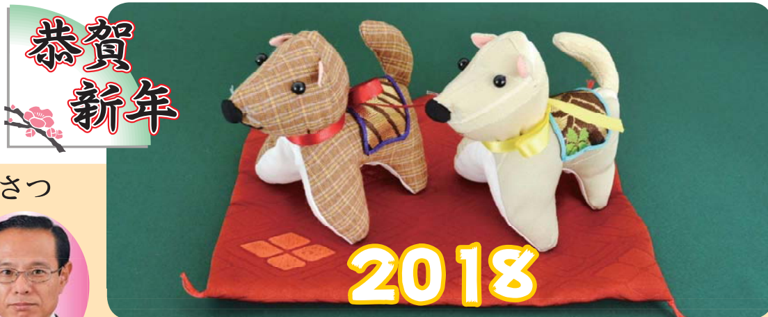
区内で活動しているボランティアグループが作成した、干支「戌」の手芸作品です。

No. 265 発行/北区議会 〒114-8508 東京都北区王子本町1丁目15番22号 TEL 03(3908)9948