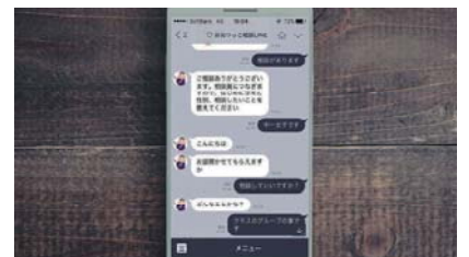
LINEによるいじめ相談受付のイメージ(滋賀県大津市いじめ対策推進室)