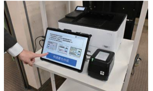
窓口での手書き負担を軽減する「書かない窓口」