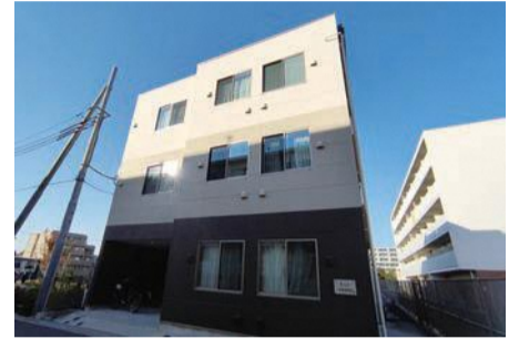
2021年開設の「ららたきのがわ」

答 特殊詐欺被害増加が見込まれており、自動通話録音機設置等により未然防止に活用してほしい。町会・自治会等の防犯カメラ設置費用は補助率を上げており、住まいの防犯対策助成事業は社会情勢等を踏まえ研究する。