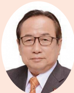
副議長 こんどう 近藤 みつのり 光則