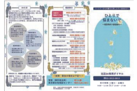
北区DV専用ダイヤルリーフレット