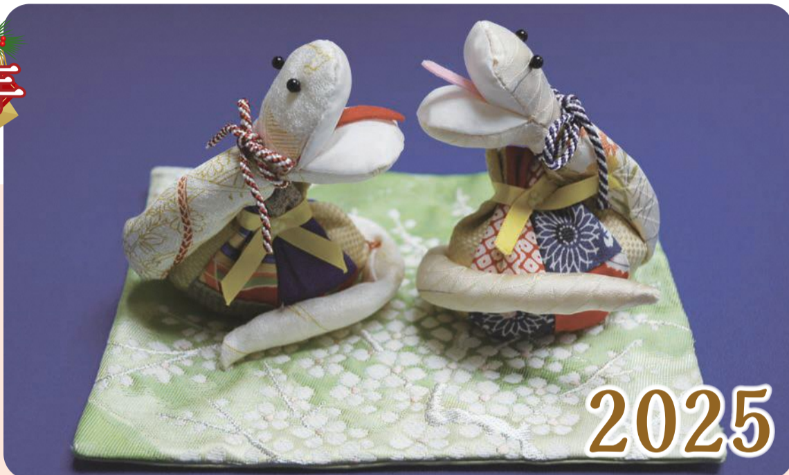
区内で活動しているボランティアグループが作成した、干支「巳」の手芸作品です。