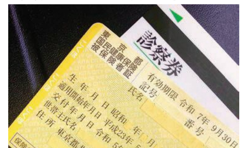
新規発行されなくなった健康保険証

答 生活保護基準は、国において適切に決定されていると認識。国での夏季加算の議論は把握していないが、生活保護制度は、国が対応すると認識しており、動向を注視していく。