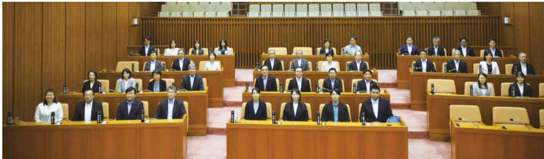
令和6年第3回臨時会での撮影

No. 297 発行/北区議会 〒114-8508 東京都北区王子本町1丁目15番22号 TEL 03(3908)9948