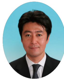
副議長 えの かもと 榎本はじめ