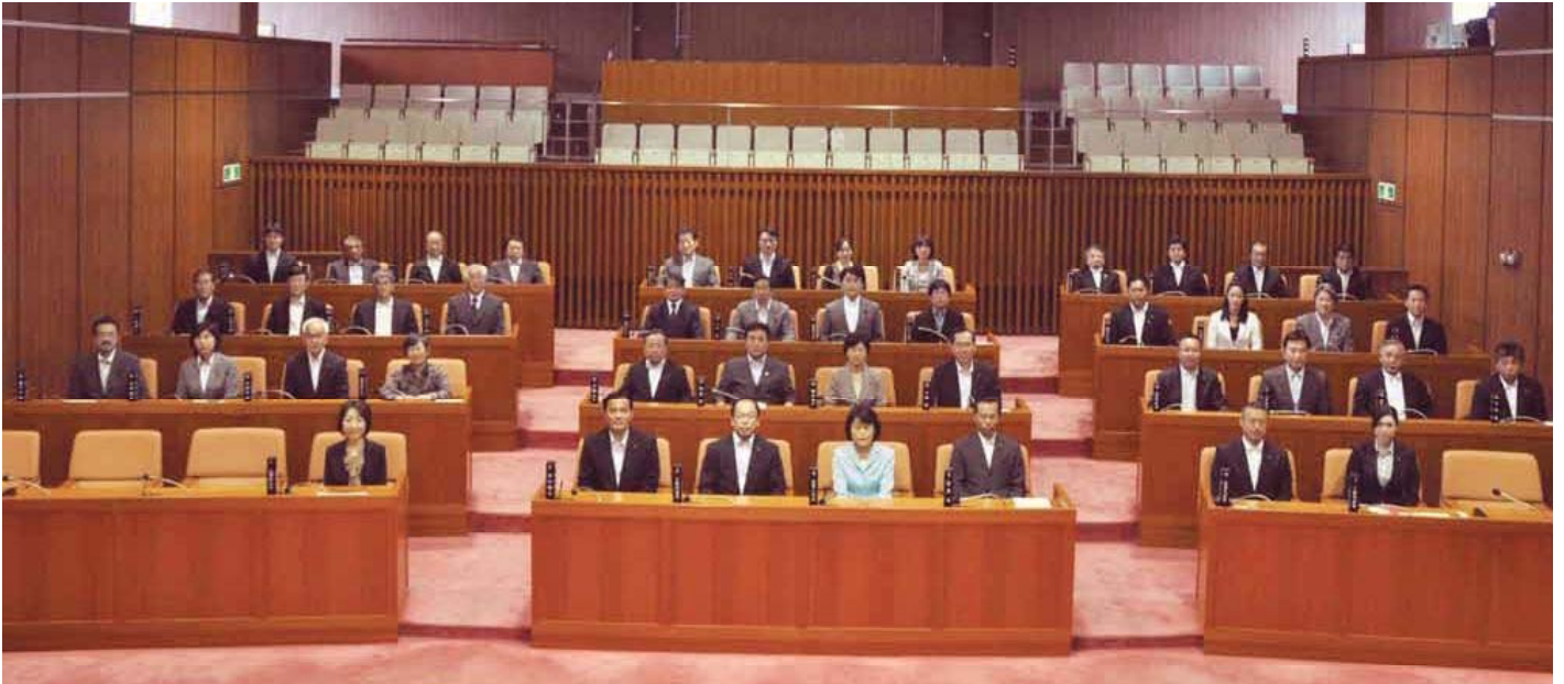
新しい議席配置図

NO. 237 発行/北区議会 〒114-8508 東京都北区王子本町1丁目15番22号 TEL(3908) 1111(大代表)