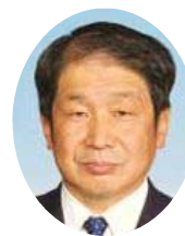
副議長 土屋さとし