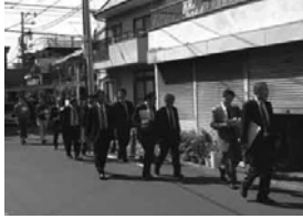
目黒本町5丁目地区を視察