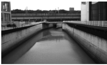
王子駅付近石神井川

問 政府に対し、今こそ唯一の被爆国として、核兵器廃絶のイニシアチブをとるよう求めよ。 答 政府は核実験即時停止と核兵器廃絶を全世界に訴え、このたびも、日本のイニシアチブで国連安全保障理事会を開催を実現させたと同様に、都の交付金等を活用し正規、長期雇用を軸に雇用問題は国、都の事業の趣旨を踏まえ着実に実施済み等に、利用料の心配