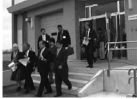
浮間地区荒川防災ステーションを視察

地域開発特別委員会 4月28日 ○視察を行いました。 目黒区木造住宅密集地域整備事業の現状について、目黒区都市整備部職員から説明を聴取し、目黒区目黒本町5丁目地区を視察しました。