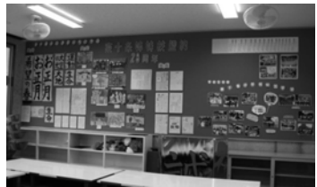
与論島東十条小コーナー

われている。東十条小の取組みを参考に支援のあり方を検討していく。 問 地域包括支援センターはスタートから3年が経過し扱う人数が増え、内容も広く重くなっている。内容を検証し問題点を見直すべき。一人暮らしの認知症高齢者対応や高齢者虐待等困難ケースの増加、特定高齢者の把握等新たな課題も生じている。様々な問題解決の中核的拠点としてセンターの機能強化に取組んでいく。地域包括支援センターは