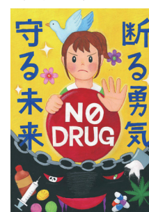
平成26年度薬物乱用防止ポスター東京都選考最優秀賞作品

答 区立学校の教員及び保護者を対象に、いじめ問題対応研修会を実施し、子どものソーシャルネットワークサービスの利用実態やトラブル内容、安全な使用方法等について理解を深めた。今後も、子ども達の情報モラルの徹底と、研修の充実に努める