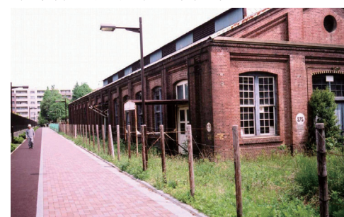
中央図書館建設前の赤レンガ建物

答 区では、昭和61年3月15日に平和都市の宣言を行っている。また新年度には、戦後70年誌の作成等も予定しており、今後も平和で自由な共同社会の実現に向け努力していく。