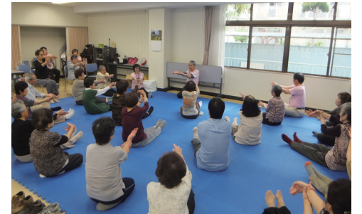
ふれあい交流サロンの様子