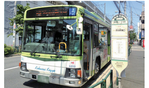
国際興業バス赤06系統