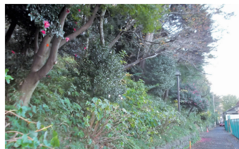
飛鳥山公園の崖地