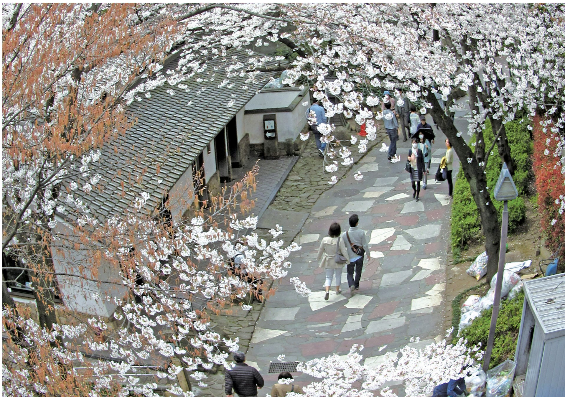
「春が来た」音無親水公園

No. 256 発行/北区議会 〒114-8508 東京都北区王子本町1丁目15番22号 TEL 03(3908)9948