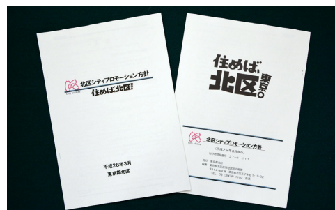
北区シティプロモーション方針