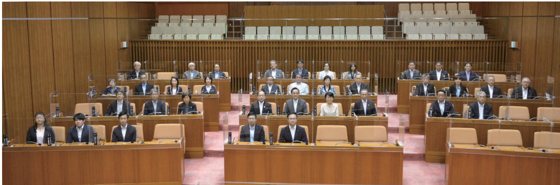
令和4年第2回臨時会での撮影

No. 287 発行/北区議会 〒114-8508 東京都北区王子本町1丁目15番22号 TEL 03(3908)9948