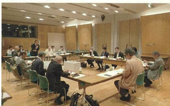
写真1 委員会の開催風景