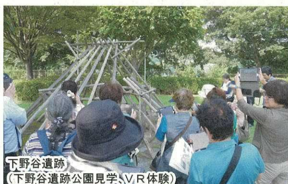
写真2 ワークショップの開催風景