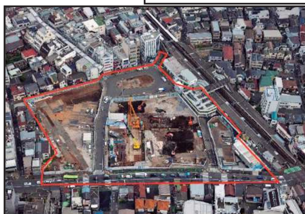
令和3年3月末(解体完了後)