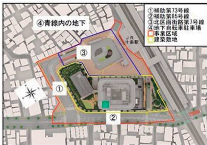
各施設の配置イメージ