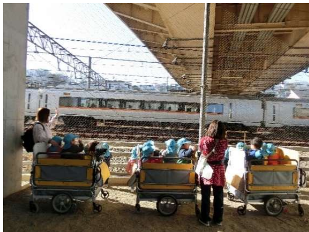
線路近くで電車を見ると、大喜びの子どもたちです。 (1歳児)