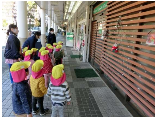
友達と手を繋いで歩くことも上手になってきました。(2歳児)