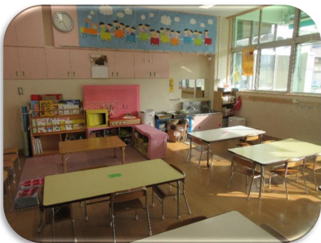
④ 1階 保育室 3歳児 うさぎ組