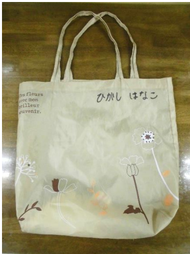
【着替えた衣類入れ（エコバック）】