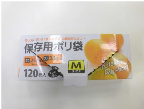
【ビニール袋】（25cm x 35cm 程度）