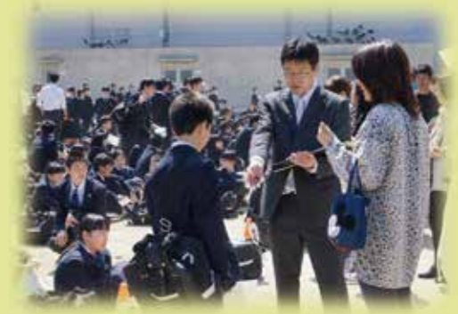
幼小中合同引き取り訓練

幼小中一貫した流れの中で、つまづいている学習内容を共有することや、一人1台端末「きたコン」をはじめとしたICT機器を活用した深い学びを推進します。また、防災に関する活動も継続しています。幼小中合同引き取り訓練や生活安全協議会を実施することで、保護者・地域と連携した防災教育を推進します。