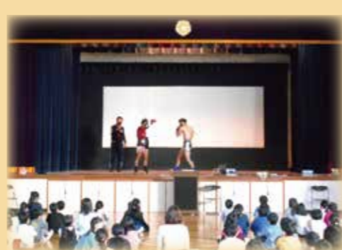
タイ大使館との交流

幼・小・中での国際理解教育を通して、広く世界を見つめ、日本人としての自覚と誇りを持ち、国際社会に主体的に貢献し、共生社会を共に生き抜いていく資質・能力を育てます。また、オリンピック・パラリンピックレガシーアワード校での取組を通し、「豊かな国際感覚」の醸成をねらいとして、スポーツを愛し、平和な社会や共生社会の実現を見据えた世界に貢献できる資質・能力を育成します。