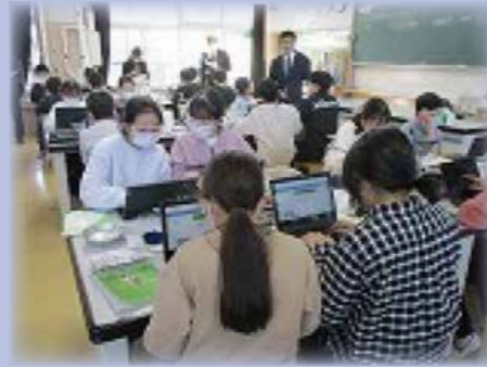
きたコンを使った授業の様子

幼児・児童・生徒の発達や連続性を配慮し、授業改善と学校行事等での交流学习を通じた、幼小中一貫教育の推進をしています。