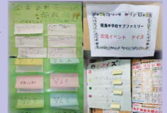
小中によるクイズ交流の掲示

北区民としての教養の基礎を培うため、読み聞かせや読書週間、自立した生き方を目指す読書の方法などの教育を推進します。