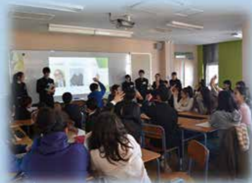
東京国際フランス学園との交流

英語や英語活動の授業を中心にコミュニケーション能力の向上を目指した授業改善を推進するとともに、東京国際フランス学園との行事や授業での交流を通して国際理解教育を充実させます。