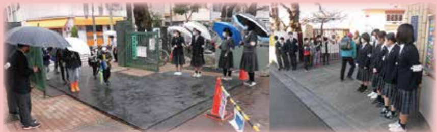
田端中ファミリー挨拶プロジェクト

小・中学校が相互に関わり9年間通して、たばたの100冊（読書活動）、NIE教育、特別活動の3部門を田端中ファミリーの柱の取組として活動します。活動を通して、子どもが主体的に学び、豊かな感性を磨き、幅広い知識を得ることを目標にします。そして、社会への関心を高め、考える力や表現力、想像力等、生きていく上での大切な力を育てていきます。