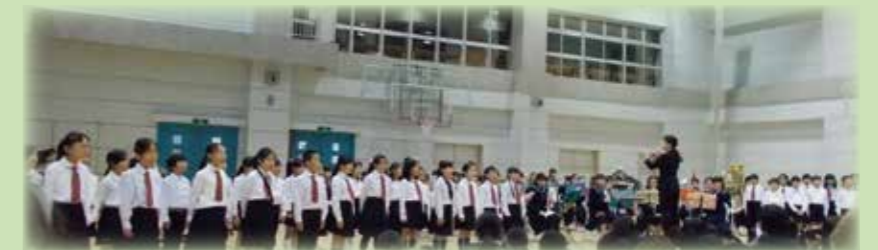
ファミリーコンサート

「主体的・対話的で深い学び」の実現に向けた授業改善を実践することで、学力の定着・向上を図ります。また、小中9年間で一貫した学習規律や生活習慣等の確立を進めます。授業研究以外にも、合同行事、児童・生徒理解にも研究の幅を広げています。