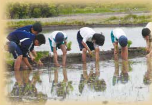
小中合同農業体験

「学びの一貫性」（学習スタンダード）をもたせるとともに、体験学習に基づく援農教育は、区内唯一の特色ある教育活動であり、小・中学生の共同作業へと展開をしています。また、一貫性のある生活指導や学校行事のコラボを行い、9年間を通じて系統的に子どもを育てていきます。