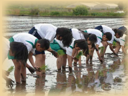
小学生と中学生と一緒に農業体験

「学びの一貫性」(学習スタンダード)をもたせるとともに、体験学習に基づく援農教育は、区内唯一の特色ある教育活動であり、小・中学生の共同作業へと展開をしています。また、一貫性のある生活指導や学校行事のコラボを行い、9年間を通じて系統的に子どもを育てていきます。