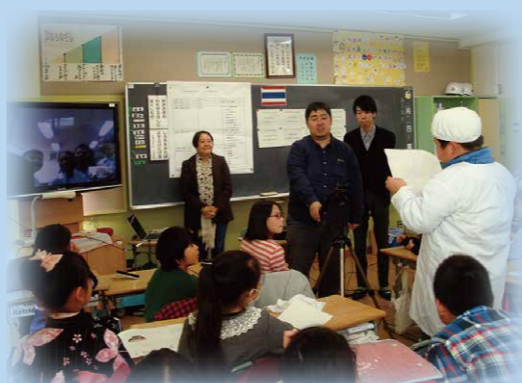
タイ王国の小学校との交流授業

イングリッシュサポーター(外国人講師)が、放課後に英会話講座等を行うイングリッシュプラザを開催し[中学校を中心として実施]英語の力を高めていきます。また、コミュニケーション能力の向上に向けた授業改善や東京国際フランス学園との交流などを通して、国際理解教育を推進します。