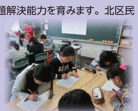
学校司書を活用した授業

学校図書館指導員(学校司書)を活用し、学校図書館の整備を進め、読書活動や言語活動の一層の充実を図ります。読書量と学力には正の相関があり、児童・生徒の自主的な学びを深め、問題解決能力を育みます。北区民としての教養の基礎を培うため、読み聞かせや読書習慣、自立した生き方を目指す読書の方法などを教育するものです。