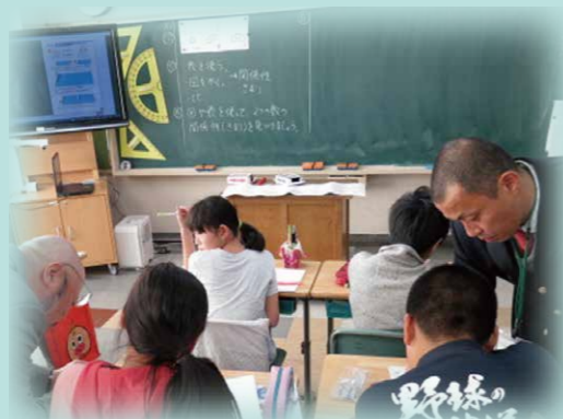
ICT 機器を用いた授業

新聞の読み比べや付箋を利用した情報のまとめ、調べ学習・発表等の情報活用を取り入れた授業、また、電子黒板や携帯情報端末、デジタル教科書等のICTを取り入れた授業の取り組みを通して、思考力・判断力・表現力と他者とかかわる力を育成する新しい学びを創造します。