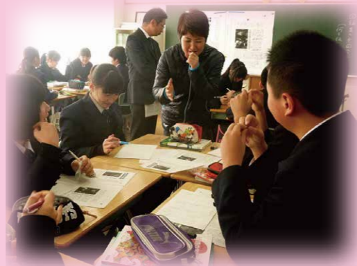
新聞を活用した授業

NIE(Newspaper In Education の略、新聞を教材・学習材として活用する学習)の手法を取り入れ、言語活動の充実を図るとともに、情報活用能力や思考力・判断力・表現力等を育成します。社会の出来事に興味をもち、生涯にわたって学び続ける基礎を育みます。