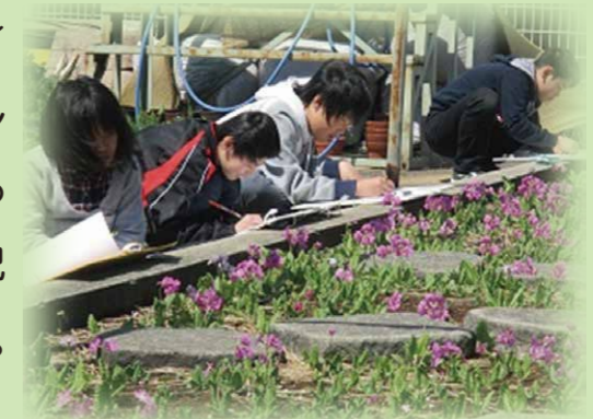
さくら草の写生授業

「花・音・風-情操教育の推進-」として、浮間地域の豊かな自然環境を生かし、地域の方々と伝統あるサクラソウの栽培を通して、郷土を愛する心を育みます。また、音楽交流やボランティア活動などを推進して、社会貢献できる豊かな心をもった児童・生徒を育成します。