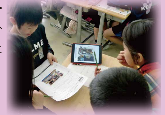
コミュニケーションによる課題解決型授業

一人ひとりの社会的・職業的自立に向け、必要な基盤となる能力や態度（自立した社会人として生きるために必要な力）を育みます。「基礎的・汎用的能力」の育成を通して、自立・協働・創造に向けた一人ひとりの主体的な学びにつなげていきます。