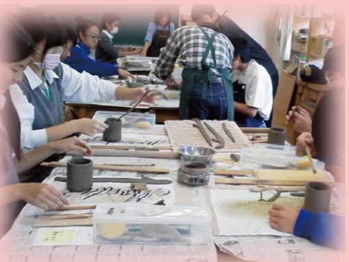
オープンスクール【陶芸】の様子

地域の方々をゲストティーチャーとして招へいし、田端に根付いた文化等を学ぶ「田端学びの郷オープンスクール」を開催しています。田端小・滝野川第四小6年生、田端中の児童・生徒と一緒に学ぶことで、異年齢集団の交流を図り、地域とともに学ぶ態度を育みます。