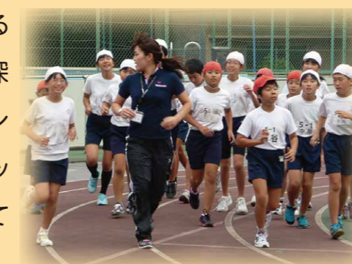
オリンピックと一緒に体育授業

オリンピック・パラリンピアンとの交流を通して、運動・スポーツにより一層親しむ取組、体力や健康の保持増進を図る取組、オリンピック・パラリンピックの歴史や意義、理念などを学習する取組、国際理解を深める取組などをオリンピック・パラリンピック教育として推進していきます。