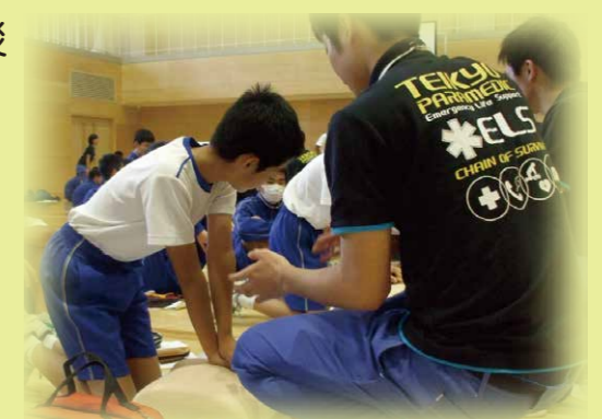
人体模型を用いた蘇生体験

防災教育小中一貫年間指導計画を策定し、それに基づく防災授業や体験等を実施します。また、小中合同引き取り訓練や地域総合防災訓練など、保護者・地域と連携した小中一貫型防災教育を推進します。