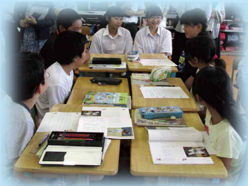
小学生と中学生の交流授業

「桐ヶ丘心の教育ネットワーク」として、桐ヶ丘地域の心の教育を充実させ、豊かな教育力を育みます。SFを中心として、学校の道徳教育の充実を目指すとともに、保護者や地域関係機関と連携を工夫しながら推進していきます。