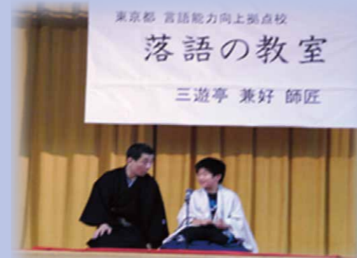
落語家を招いた授業

言語環境を整えるとともに、言語に対する関心や理解を深め、思考力のベースとなる言語力を育成します。各教科においては、対話・記録・要約・説明・発表・討論などの言語活動を充実させ、論理的思考力や表現力を育成します。