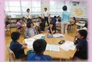
コミュニケーションによる課題解決型授業

一人ひとりの社会的・職業的自立に向け、必要な基礎となる能力や態度（自立した社会人として生きるために必要な力）を育みます。「基礎的・汎用的能力」の育成を通して、自立・協働・創造に向けた一人ひとりの主体的な学びにつなげていきます。