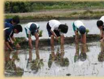
小中合同農業体験

「学びの一貫性」（学習スタンダード）をもたせるとともに、体験学習に基づく援農教育は、区内唯一の特色ある教育活動であり、小・中学生の共同作業へと展開しています。また、一貫性のある生活指導や学校行事のコラボを行い、9年間を通じて系統的に子どもを育てていきます。