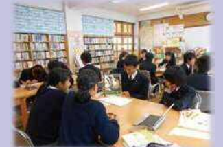
学校司書を活用した授業

学校図書館指導員（学校司書）を活用し、学校図書館の整備を進め、読書活動や言語活動の一層の充実を図ります。読書量と学力には正の相関があり、児童・生徒の自主的な学びを深め、問題解決能力を育みます。北区民としての教養の基礎を培うため、読み聞かせや読書習慣、自立した生き方を目指す読書の方法などを教育するものです。