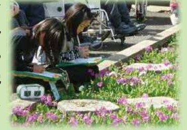
さくら草の写生授業

「花・音・風—情操教育の推進—」として、浮間地域の豊かな自然環境を生かし、地域の方々と伝統あるサクラソウの栽培を通して、郷土を愛する心を育みます。また、音楽交流やボランティア活動などを推進して、社会貢献できる豊かな心をもった児童・生徒を育成します。