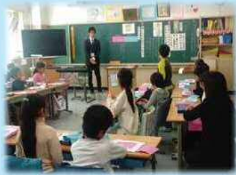
北区学校ファミリーの日の道徳授業

「桐ヶ丘心の教育ネットワーク」として、桐ヶ丘地域の心の教育を充実させ、豊かな教育力を育みます。SFを中心として、学校の道徳教育の充実を目指すとともに、保護者や地域関係機関と連携を工夫しながら推進していきます。