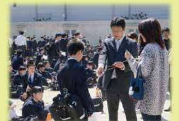
小中合同引き取り訓練

防災教育小中一貫年間指導計画を策定し、それに基づく防災授業や体験等を実施します。また、小中合同引き取り訓練や地域総合防災訓練など、保護者・地域と連携した小中一貫型防災教育を推進します。