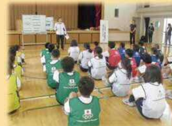
オリンピックと一緒に JOC オリンピック教室

オリンピック・パラリンピアンとの交流を通して、運動・スポーツにより一層親しむ取組、体力や健康の保持増進を図る取組、オリンピック・パラリンピックの歴史や意義、理念などを学習する取組、国際理解を深める取組などをオリンピック・パラリンピック教育アワード校として推進していきます。