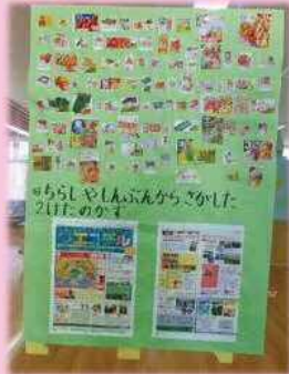
新聞を活用した算数の授業

NIE(Newspaper In Education の略、新聞を教材・学習材として活用する学習)の手法を取り入れ、言語活動の充実を図るとともに、情報活用能力や思考力・判断力・表現力等を育成します。社会の出来事に興味をもち、生涯にわたって学び続ける基礎を育みます。