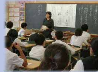
言語力を育成する授業

言語環境を整えるとともに、言語に対する関心や理解を深め、思考力のベースとなる言語力を育成します。各教科においては、対話・記録・要約・説明・発表・討論などの言語活動を充実させ、論理的思考力や表現力を育成します。