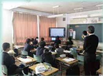
ICTを取り入れた授業

新聞の読み比べや付箋を利用した情報のまとめ、調べ学習・発表等の情報活用を取り入れた授業、また、電子黒板や携帯情報端末、デジタル教科書等のICTを取り入れた授業の取り組みを通して、思考力・判断力・表現力と他者とかがわる力を育成する新しい学びを創造します。