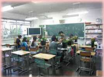
オープンスクール【アレンジ生け花】の様子

地域の方々をゲストティーチャーとして招へいし、田端に根付いた文化等を学ぶ「田端学びの郷オープンスクール」を開催しています。田端小・滝野川第四小6年生、田端中の児童・生徒と一緒に学ぶことで、異年齢集団の交流を図り、地域とともに学ぶ態度を育みます。