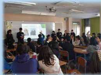
東京国際フランス学園との交流

イングリッシュサポーター（外国人講師）が、放課後に英会話講座等を行うイングリッシュプラザを開催し〔中学校を中心として実施〕英語の力を高めていきます。また、コミュニケーション能力の向上に向けた授業改善や東京国際フランス学園との交流などを通して、国際理解教育を推進します。