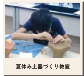
夏休み土器づくり教室