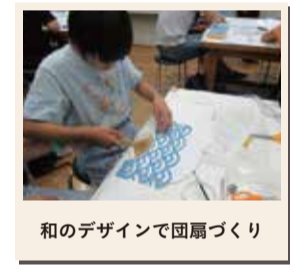
和のデザインで団扇づくり