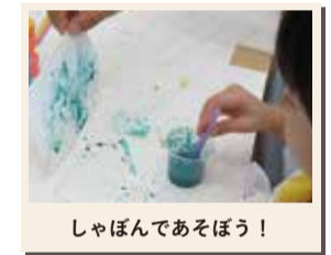
しゃぼんであそぼう!