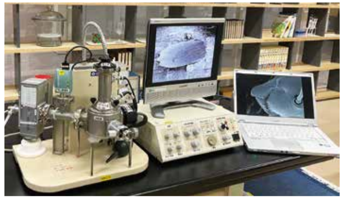
図1 サイエンスルームで電子顕微鏡を使って観察しているところ