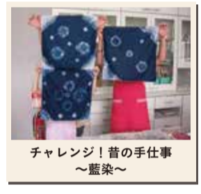
チャレンジ! 昔の手仕事～藍染～

藍染や縄文土器、勾玉などの工作教室や、調べ学習、博物館のバックヤードツアーなど、小・中学生向けイベントを多数開催します。未就学児向けのしゃぼん玉遊び講座もあります(一部を除き、事前申込制)。※申込方法など、詳しくは北区ニュース6月20日号や当館ホームページ等をご覧ください。