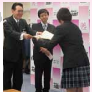
平成28年度第2回贈呈式の様子

例年、12月と3月に顕彰の贈呈式を行っており、「平成29年度第1回北区子どもかがやき顕彰 北区かがやき賞」の受賞者は以下のとおりです。