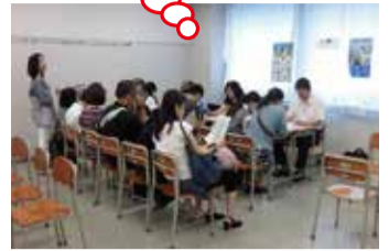
中学3年生はもちろん、1・2年生の参加も大歓迎です!

主催 東京都北区立中学校PTA連合会 共催 北区教育委員会・北区立中学校長会 協力 東京都立飛鳥高等学校 事務局 北区立王子桜中学校