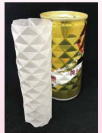
ダイヤカットのパターンに折った 折り紙とダイヤカット缶