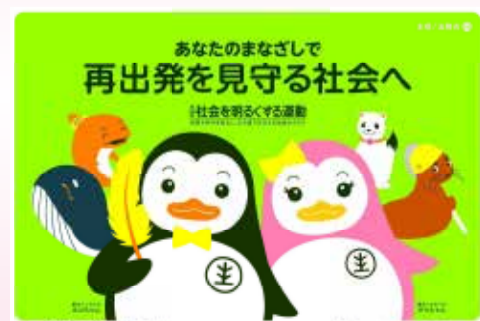
7月は“社会を明るくする運動”強調月間・再犯防止啓発月間です。

“社会を明るくする運動”は、犯罪や非行の防止と罪を犯した人の立ち直りについて理解を深め、力を合わせて、犯罪のない地域社会をつくらうとする全国的な運動です。