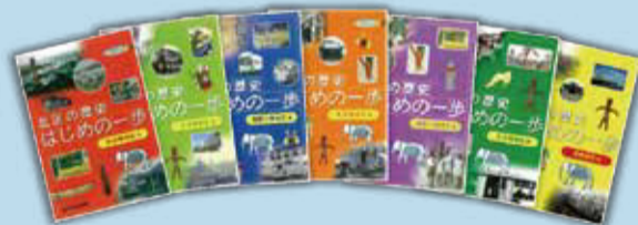
※『はじめての一步』既刊本 左から赤羽東、王子東、滝野川東、赤羽西、滝野川西、王子西、浮間地区編