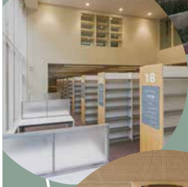
・さくら草ルーム(多目的ホール)