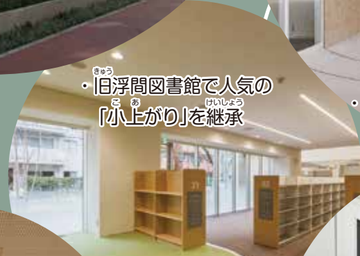
・旧浮間図書館で人気の「小上がり」を継承