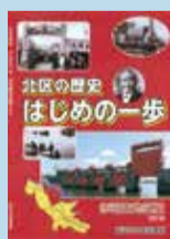
今回刊行した『赤羽東地区編 改訂版』

この本は、北区立図書館で閲覧・貸出しており、中央・滝野川・赤羽の3館では購入もできます。また、毎年、区立小学校の3年生児童全員に、学校を通して配布しています。ぜひ、ご覧ください。