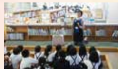
指導員による図書紹介

また、公共図書館では、レファレンスといって、探している本や調べたいことが載っている本を紹介するサービスを提供しています。