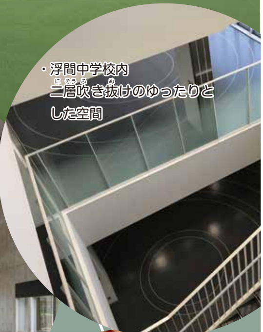
・浮間中学校内 二層吹き抜けのゆったりとした空間