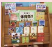
学校図書館でのテーマ展示

学校図書館では、数千冊から1万冊を超える本が皆さんを待っています。毎年、新しい本を購入し、おすすめ本、テーマにそった本なども紹介しています。