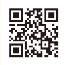
にっこりパスポート 専用ホームページ

<「北区子育てにっこりパスポート」って、何ですか？> 協賛店（区内（一部区外）の登録店舗）で提示すると、買い物などをした時に割引や特典などが受けられるカードです。