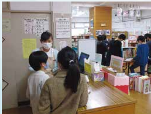
遠慮しないでどんどん図書館の人に聞いちゃおう

もし自分で本を見つけることができなくても、決してあきらめないでください。そんな時は、ちょっと勇気を出して、図書館の人に声をかけてください。図書館ではレファレンスサービスといい、