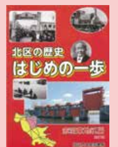
昨年刊行した 『赤羽東地区編 改訂版』

※『はじめての一步』は、毎年、区立小学校の3年生児童全員に学校を通して配布しています。また、区内全図書館で閲覧・貸出しているほか、中央・滝野川・赤羽の3図書館と北区役所本庁舎内区政資料室、飛鳥山博物館、区内一部書店で購入もできます。(改訂版定価：400円)