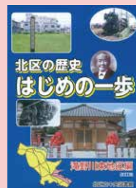
『滝野川東地区編 改訂版』