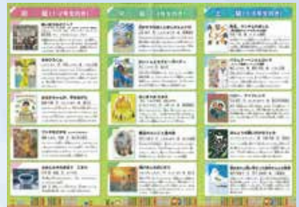
「よまれたがりやの本たち」中面

今、興味をもてることがないという人には、本の内容を書いたガイドブックなどもヒントになりますので、活用してください。