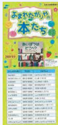
「よまれたがりやの本たち」表紙

みなさんの質問に答え、資料の紹介や案内をしています。皆さんからのお声がけを待っています。事前の準備として自分が聞きたいことをまとめてきてくれるととても助かります。