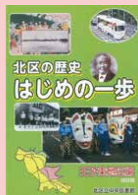
『王子東地区編 改訂版』

『北区の歴史はじめての一步』の良いところはそのままに、新たな歴史を加え、さらに読みやすく充実した内容となっています。残り4地区編についても順次改訂していく予定ですので、ぜひ、ご覧ください。