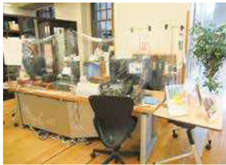
▲レファレンスカウンター(中央図書館)