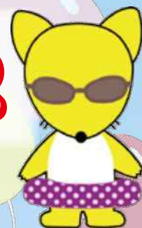
博物館オリジナルキャラクター コン吉

夏の北区飛鳥山博物館では、今年も「夏休みわくわくミュージアム」を開催します！ 今回は「Made in 北区」をテーマにした展示に加えて、たくさんの体験講座を実施予定です。