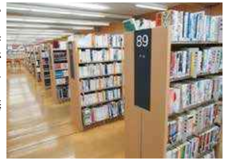
▲YAコーナー(中央図書館)

YAとは中・高校生 (Young Adult) のことを表し、図書館では10代の利用者の皆さんがよい本と出会うきっかけ作りをサポートしています。YA世代に人気の本や役立つ本などはYAコーナーに取り揃えています。YAコーナーがない図書館では一般図書の棚に置かれていて、一般図書とは異なる背ラベルの色(青)で区別し、探しやすくなっています。今後の人生の相棒と呼べる本に出会えるかもしれませんよ。