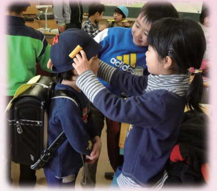
きらきら0年生応援プロジェクト