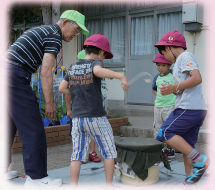
放課後子ども総合プラン（わくわく☆ひろば）

ブックスタート ブックスタートフォローアップ 3歳児絵本プレゼント おはなし会等の充実 子育て情報支援サービスの充実 教育広報紙「くおん」の発行 子育て応援サイトの構築・運用 PTA活動支援 家庭教育力向上プログラム 家庭教育学級