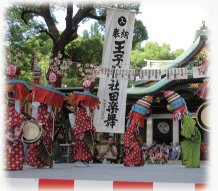
継承者の育成支援

区民大学 あすか教室 ことぶき大学 高齢者の学習支援の充実 文化センターの充実 飛鳥山博物館の利用促進 子育て情報支援室保育事業 生涯学習情報提供の充実 学習相談体制の充実 区民とともに歩む図書館委員会の運営 北区図書館活動区民の会との協働による事業実施