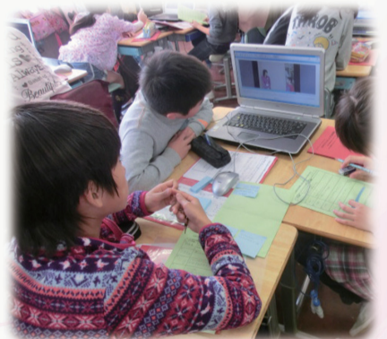
ICTを活用した授業風景