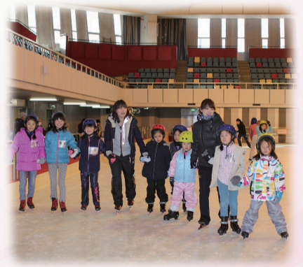
トップアスリート直伝スケート教室

北区体育協会との連携 シルバースポーツウィーク事業 スポーツ推進委員活動の充実 総合型地域スポーツクラブの設立 (仮称)赤羽体育館の建設 桐ヶ丘体育館の改築 「ランニングステーション」機能の提供 東京オリンピック・パラリンピックに向けたバリアフリー整備