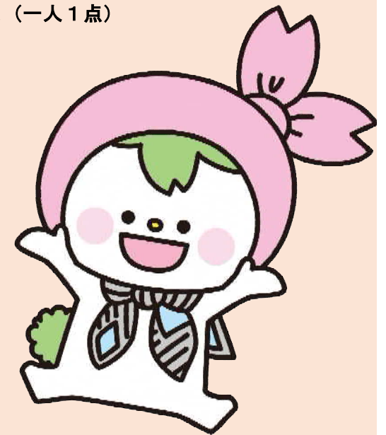
にー うさNIE 北区新聞大好きプロジェクト マスコットキャラクター

○北区長賞(最優秀賞)1点(賞状と副賞) ○北区議会議長賞1点(小学校1～3年生対象)(賞状と副賞) ○北区教育委員会賞1点(賞状と副賞) ○審査員特別賞(北区新聞販売同業組合賞)1点(賞状と副賞) ○新聞各社賞(6社)(賞状と副賞) ○優秀賞10点(賞状と副賞) ○奨励賞20点(賞状) ○参加賞(記念品)※応募者全員 ○学校賞2点(賞状と副賞)