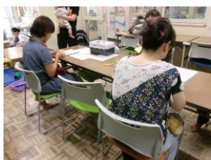
8月の ママクラフトの 様子