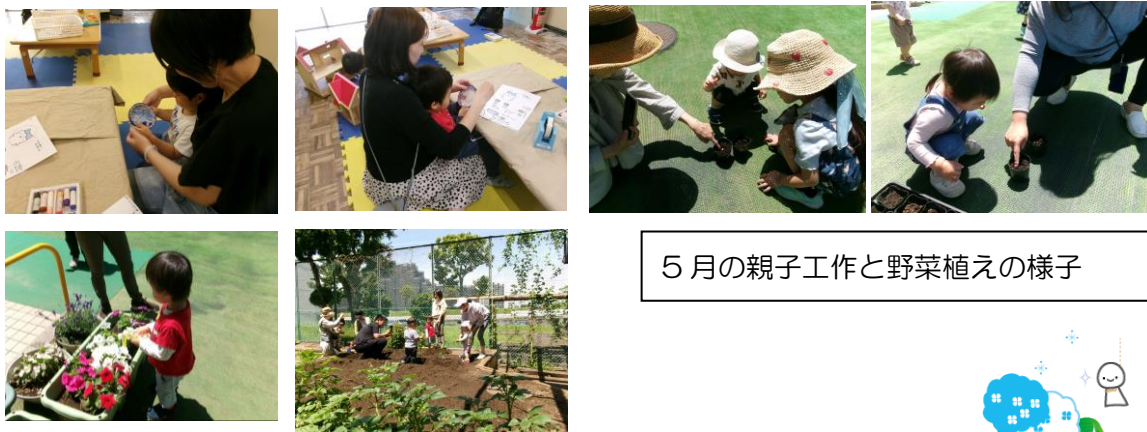
5月の親子工作と野菜植えの様子